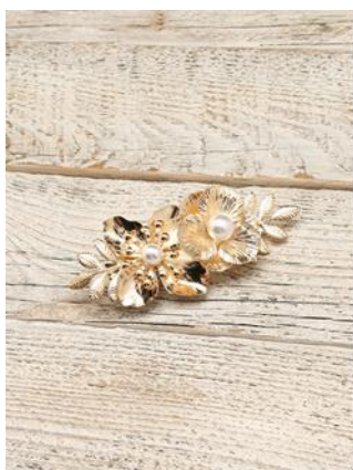
フラワーモチーフ クリップ 1,296円（税込）

Producer's Instagram： https://www.instagram.com/mitsumaru1006/