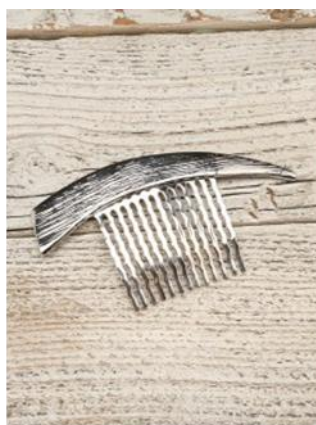
シャープライン メタルコーム 1,296円（税込）