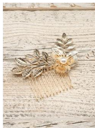
フラワーモチーフ ワイヤーコーム 1,296円（税込）